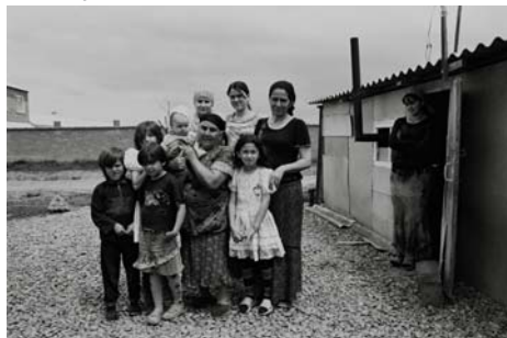
Fotografia de Maryvonne Arnaud corresponent a l'exposició "Tchéchénes hors-sol"

actuació a la sala d'exposicions temporals del MUME. A finals de mes, el dia 29, es presentarà una exposició sobre una de les problemàtiques més terribles dels darrers anys com és el cas del poble txetxè, víctima de l'ocupació militar russa i de l'extremisme religiós. Amb el nom de "Tchéchénes hors-sol" (Txetxens fora de la seva terra), l'artista francesa Maryvonne Arnaud mostrarà al voltant de 100 fotografies que reflecteixen la situació dramàtica que es viu a la república caucàsica, després d'anys de guerra i exili. La mostra arriba al MUME a través dels llaços establerts amb el Centre d'Història de la Resistència i la Deportació de la ciutat de Lió.